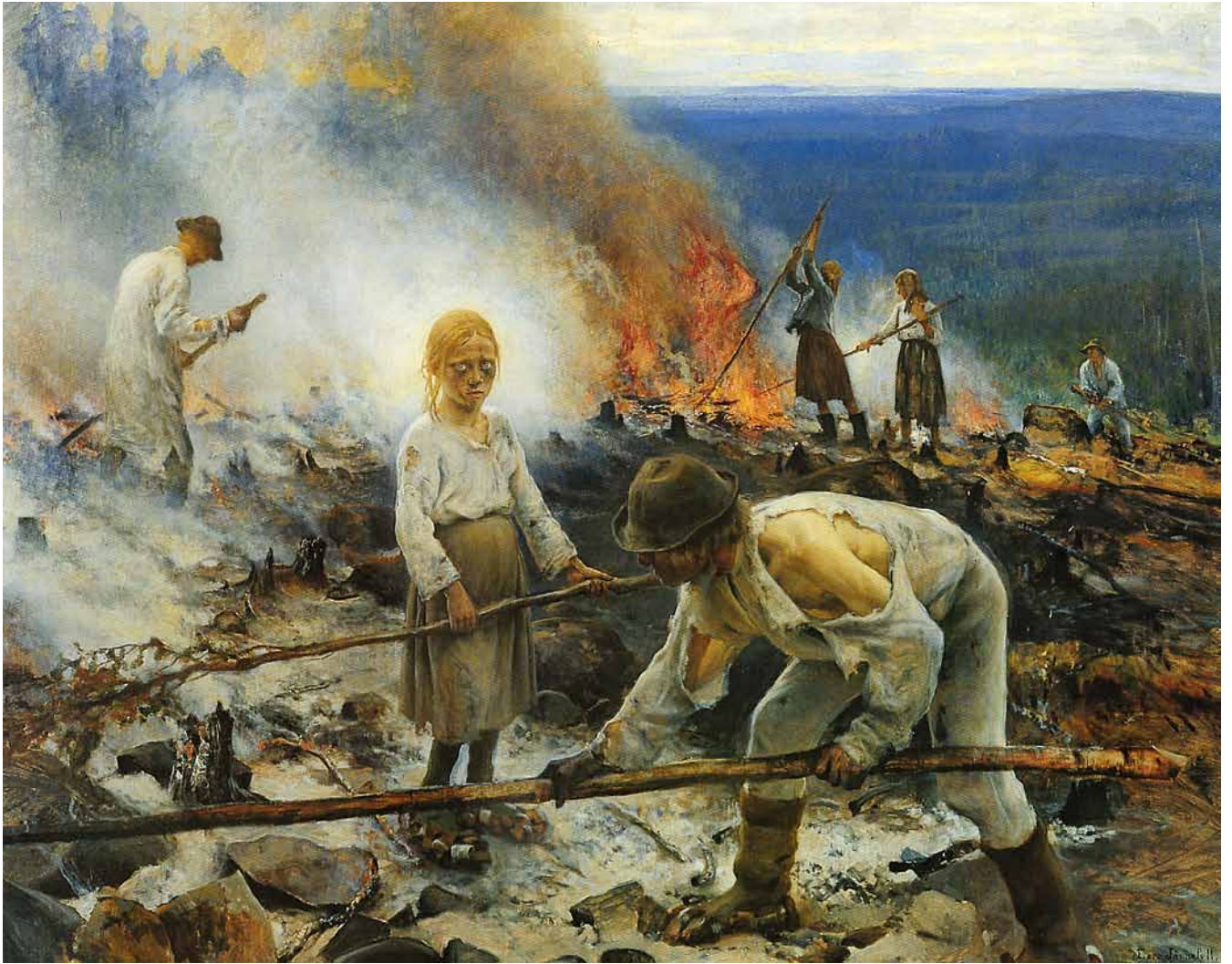
Eero Järnefelt, Raatajat rahanalaiset / Kaski (1893)