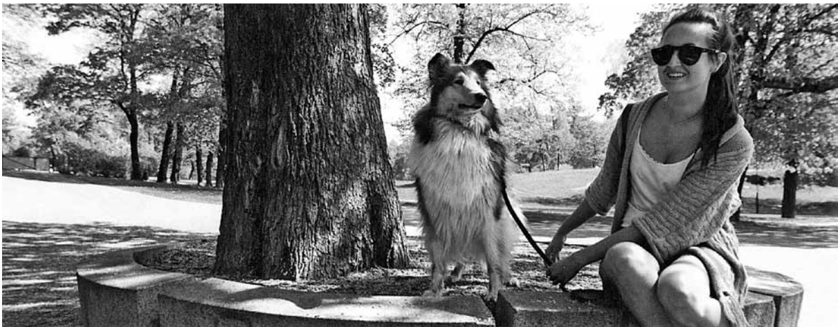
Perustietoa Suomesta (2011) Sisäasiainministeriön opas