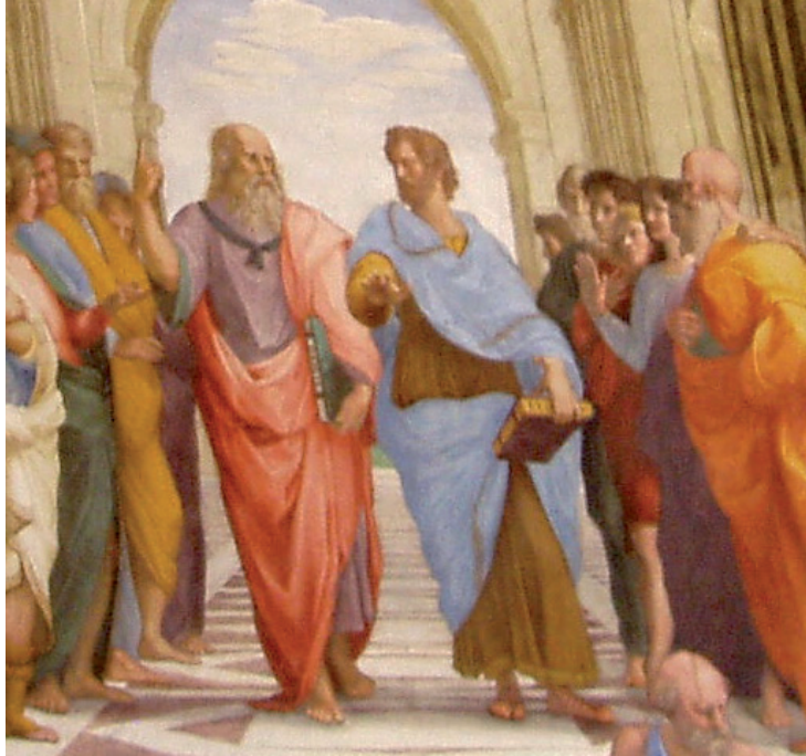
Raffaello: Ateenan koulu (1509–10), osa maalauksesta.