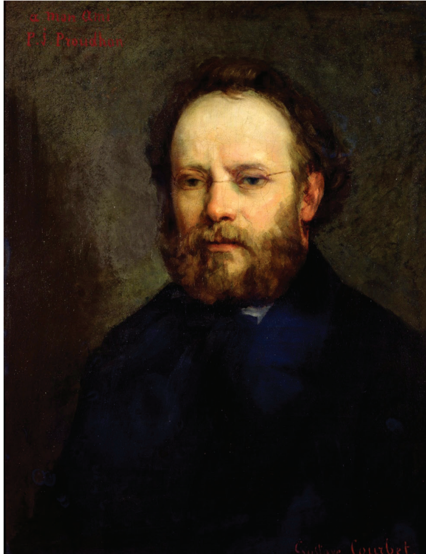
Pierre-Joseph Proudhon. Muotokuvan maalannut Gustave Courbet, 1865. < http://en.wikipedia.org >. Luettu 20.10.2014.