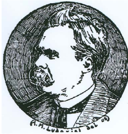
Friedrich Nietzsche 1844–1900